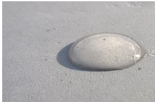
Sichtbeton mit COLORTEC® finish

(Für den Oberflächenschutz von Betonen mit betonwerksteinmäßig bearbeiteter Oberfläche, z.B. gestrahlt, gewaschen, abgesäuert, etc., empfehlen wir die Produkte COLORFRESH® intensiv, oder COLORTEC® MAX).