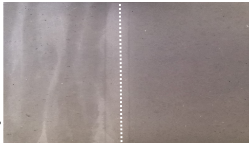
Links: ungeschützt Rechts: geschützt Foto nach längerer Freibewitterung der Betonoberfläche.

Der zu behandelnde Untergrund sollte trocken, saugfähig, sauber, frostfrei und tragfähig sein. Das Produkt COLORTEC® finish „CPS“ kann, nach entsprechenden Vorversuchen, bereits mehrere Tage nach der Entschalung des Betonbauteils angewendet werden. Aufgrund der bestehenden und ständig fortschreitenden Vielfalt der verwendeten Betone bzw. deren Herstellungsverfahren, Inhaltsstoffen, Trennmitteln... ist der ideale Applikationszeitpunkt im Vorversuch zu bestimmen, insbesondere um auszuschließen, dass eventuelle, noch auf der Betonhaut vorhandene Rückstände von Trennmitteln/Schalölen oder Nachbehandlungsmitteln das Eindringverhalten von COLORTEC® finish „CPS“ beeinträchtigen und zu Verfärbungen führen. Dies ist üblicherweise bei Betonoberflächen, welche Ihre Endfestigkeit erreicht haben, weniger relevant.