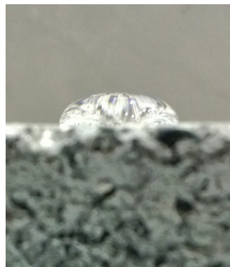
Rechts: geschützt mit COLORTEC ® MAX

Weitere Bilder von geschützten Betonoberflächen finden Sie in unserer Online- Fotogalerie .