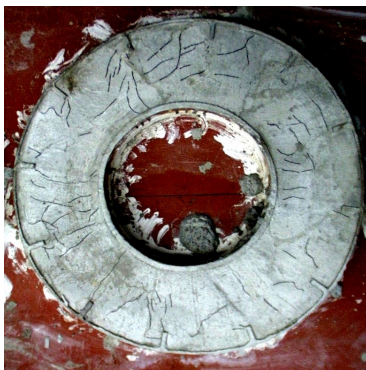
Nullmischung: Starke Schwindrissbildung