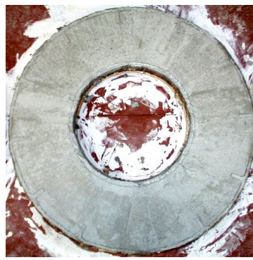
Mischung mit TECHNOFIBER®: ohne Rissbildung

! Bitte beachten Sie die Notwendigkeit der praxisgerechten Vorversuche, welche das geplante Herstellungsverfahren und die beabsichtigte Verwendung realitätsgetreu erfassen.